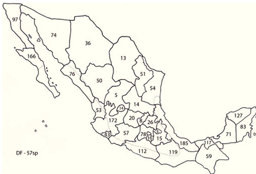
Figura 3. Riqueza específica del phylum Platyhelminthes en vertebrados silvestres por estado de la República Mexicana.

en 1 014 localidades. En la vertiente del golfo de México, Veracruz exhibe la mayor riqueza específica con 185, seguido por Yucatán con 127 y Tabasco con 117; en la costa del Pacífico, sobresalen Jalisco con 172 especies, Baja California Sur con 166, así como Oaxaca y Guerrero con 119 y 112, respectivamente. En el centro y norte del país,