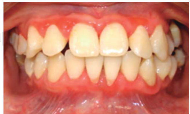
Figura 1. Fotografía clínica preoperatorio.