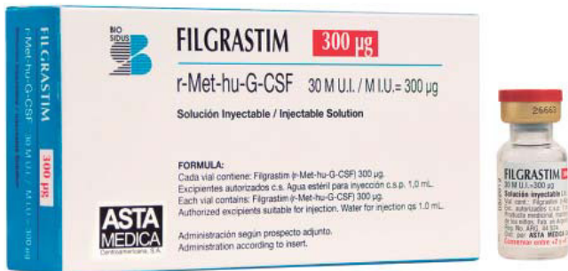
Figura 4. Filgrastim, factor estimulante de colonias; ayuda al organismo a producir neutrófilos.