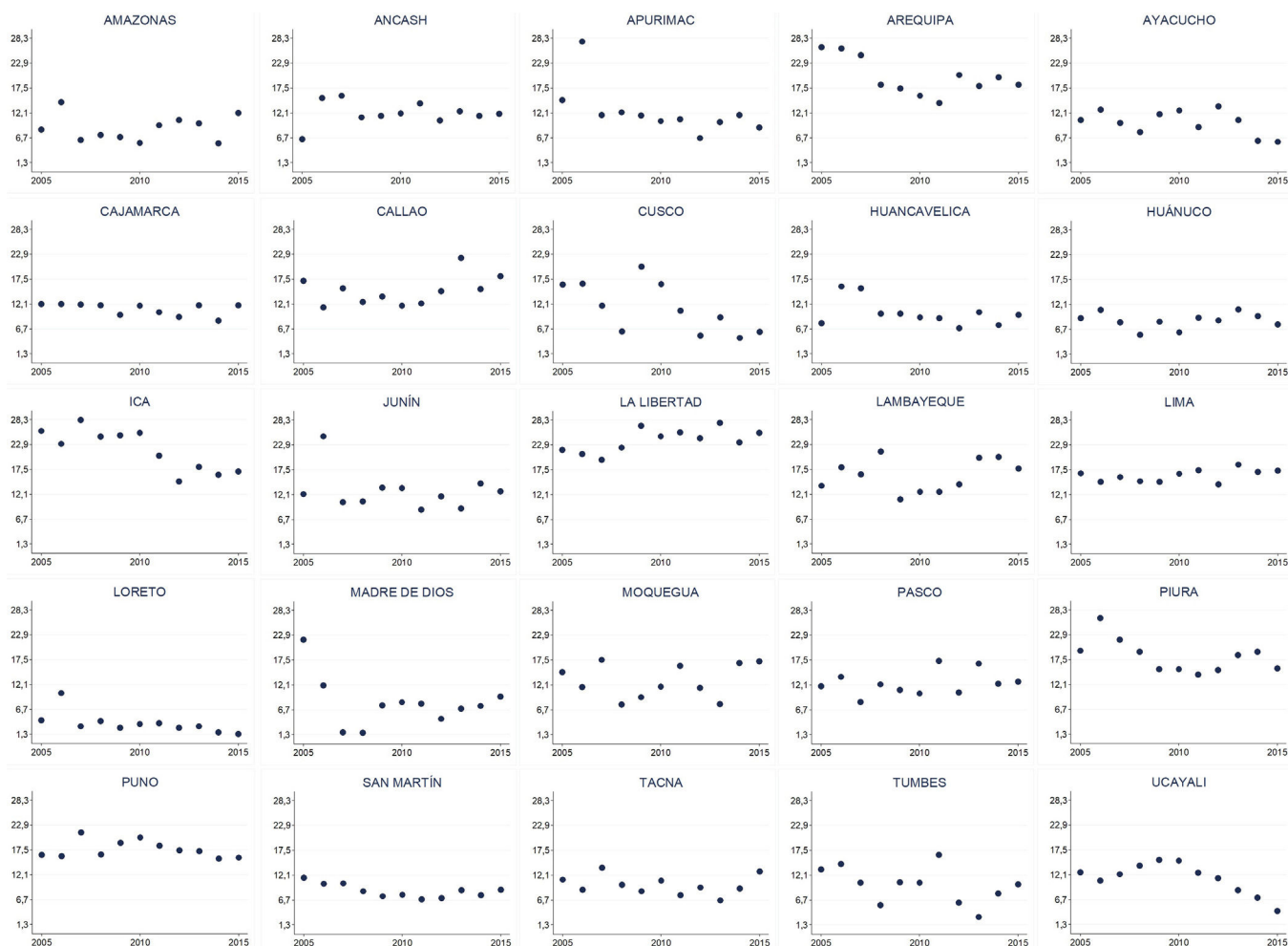
Figura 2 – Evolución de la mortalidad por enfermedad cerebrovascular (por 100.000 hab) en Perú, según registro del Ministerio de Salud, 2005-2015, por departamentos.

Fuente: elaboración propia a partir del análisis de la información de la base de datos del MINSA de Perú.