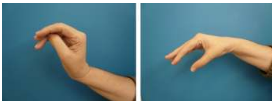
Figura 4 Resultado clínico.

No se procedió a la reconstrucción nerviosa inmediata hasta la confirmación histológica del tumor (NF solitario benigno). El postoperatorio cursó con una parálisis iatrogénica de la extensión del codo, muñeca y dedos (en 15 días recuperó la extensión del codo). Para la reconstrucción