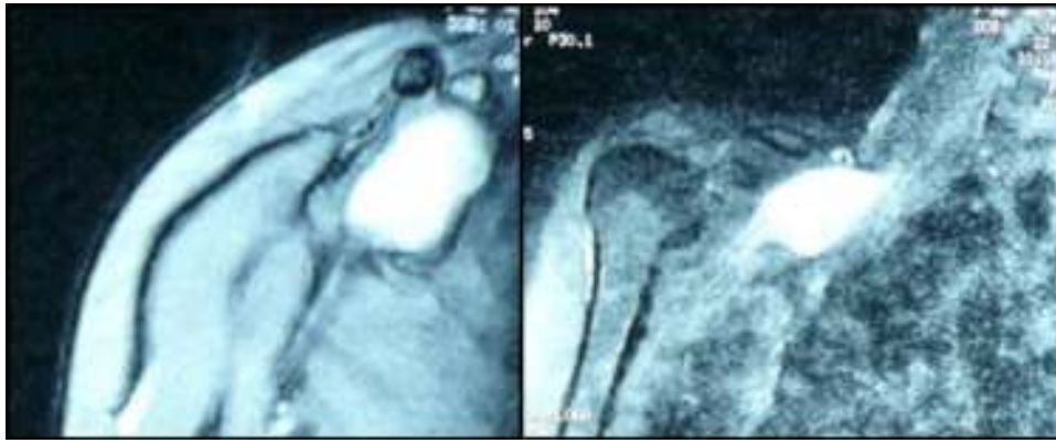
Figura 1 RNM de la tumoración.

Se presenta un caso de NF solitario en C7 confundido y tratado durante un año como una tendinopatía de «De Quervain», en el que se realizó una resección completa 2,3 y se restauró la función motora mediante transferencias nerviosas en el antebrazo 4 .