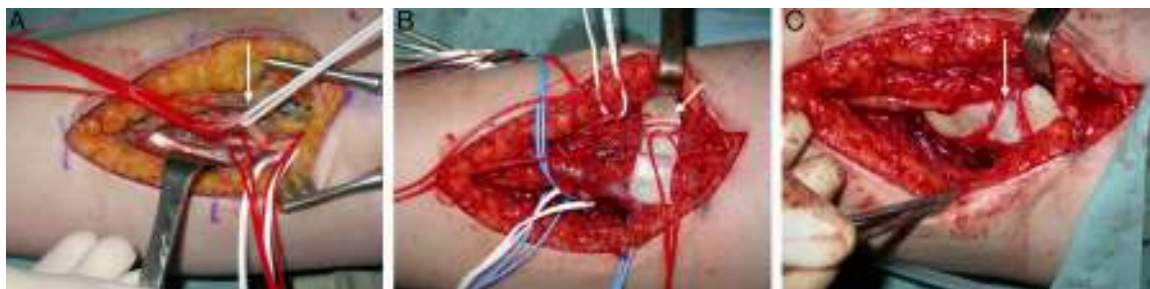
Figura 3 A) Nervio mediano y sus divisiones. B) Nervio interóseo posterior (NIOP) y rama del extensor carpi radialis brevis (ECRB). C) Unión de la rama del flexor carpi radialis del nervio mediano con el NIOP y unión de la rama de los flexores superficiales del tercer y cuarto dedos con la rama del ECRB.

de ser diagnosticados, provoca la estrangulación de los fascículos y la aparición de una neuropatía por compresión del nervio afectado. Macroscópicamente tienen forma de «huso» y microscópicamente su interrelación tan íntima con las fibras nerviosas hace que la escisión sea difícil o imposible sin provocar un daño de las mismas 1 . Según Woodfrud 6 , la degeneración maligna es muy poco frecuente, pero un NF de gran tamaño puede encubrir un tumor maligno.