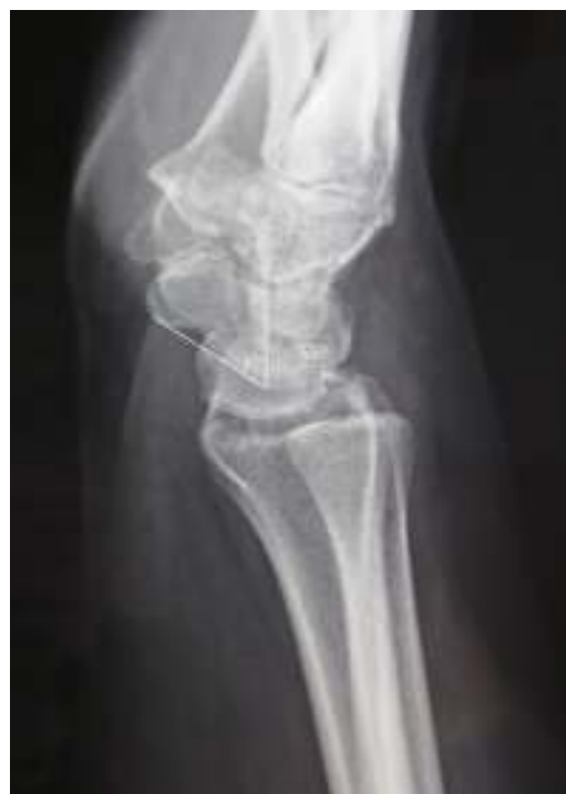
Figura 6 Radiografía lateral al final del seguimiento que muestra un ángulo EL de 55°.

Los injertos hueso-tendón-hueso 4 son una alternativa a la capsulodesis cuando no hay mal alineamiento del escafoides, ya que la reconstrucción aislada de la porción dorsal del ligamento EL no soluciona el problema de la malrotación multiplanar del carpo 3 . Utilizando un autoinjerto hueso-tendón-hueso de la segunda articulación carpometacarpina —como describe Cuénod 18 — Kalb 19 interviene 16 pacientes de los cuales 12 tienen inestabilidad estática; después de