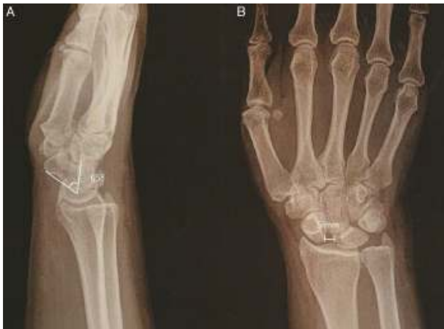
Figura 4 Radiografía preoperatoria de la inestabilidad EL estática. A) La proyección lateral muestra un ángulo escafolunar de 65°. B) La proyección anteroposterior muestra una separación EL de 5 mm.

DASH: Disabilities of Arm Shoulder and Hand ; Dcho.: derecho; F: fuerza; Izqdo.: izquierdo; kg: kilogramos.