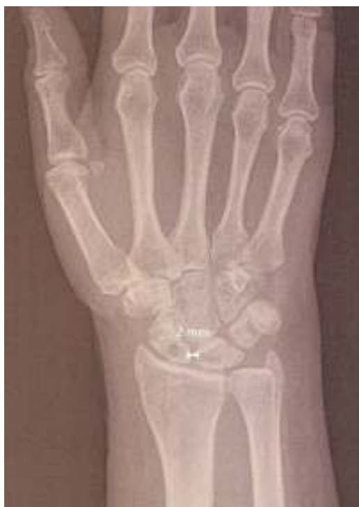
Figura 5 Radiografía postoperatoria al final del seguimiento; en la radiografía anteroposterior se aprecia una separación EL de 2 mm.

(°): grados; Dcho.: derecho; Izqdo.: izquierdo; mm: milímetros; Postop.: postoperatorio; Preop.: preoperatorio.