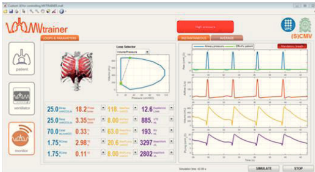
Figura 2: Pantalla del laboratorio virtual para la simulación de pacientes con ventilación mecánica (MV-Trainer) que permite predecir la respuesta del paciente ante diferentes modos de ventilación durante la terapia respiratoria.

permite simular, a través de una interfaz gráfica intuitiva, el efecto de diferentes modos ventilatorios aplicados por un ventilador mecánico a pacientes con diversas patologías y situaciones clínicas, facilitando al médico la toma de decisiones durante la terapia respiratoria.