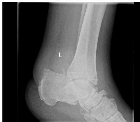
Figura 1 Paciente con artropatía de Charcot.

En cuanto al tipo de cirugía realizada: en 5 pacientes se realizó una triple artrodesis de tobillo; en 2 casos un alargamiento del tendón de Aquiles; en un paciente técnicas de liberación de partes blandas (liberación y escisión parcial de la fascia plantar); en un paciente se realizaron osteotomías del tarso, y en 5 pacientes fueron necesarias técnicas combinadas: 3 alargamientos del tendón de Aquiles sumado a transposiciones o hemitransposiciones tendinosas; una triple artrodesis asociada a osteotomía de la primera cuña y tenotomía del extensor del primer dedo, y una intervención compleja con fasciotomía plantar más liberación del gemelo medial asociado a transposiciones del tibial posterior