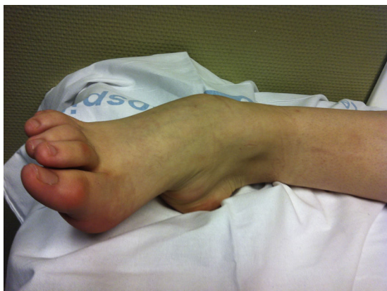
Figura 4 Pie equino-varo secundario a enfermedad de Wilson.

úlceras recidivantes, que acaban por conducir a una amputación del miembro afectado.