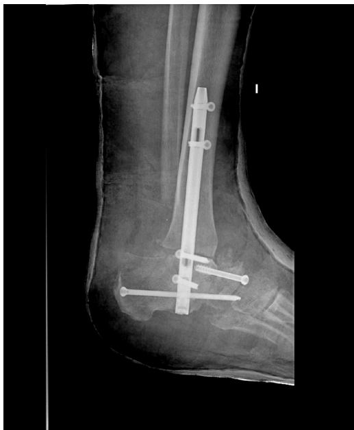
Figura 2 Triple artrodesis en el mismo paciente de la figura 1.

infección de la artrodesis, que fue tratada mediante antibiótico intravenoso durante 10 días, con mejoría clínica de la úlcera y de los parámetros bioquímicos de infección, por lo que fue dado de alta. A los 2 años de la cirugía ingresa nuevamente por una nueva infección con signos de osteomielitis crónica, secundaria a su neuroartropatía de Charcot, que obligó a una amputación transtibial de su pierna izquierda.