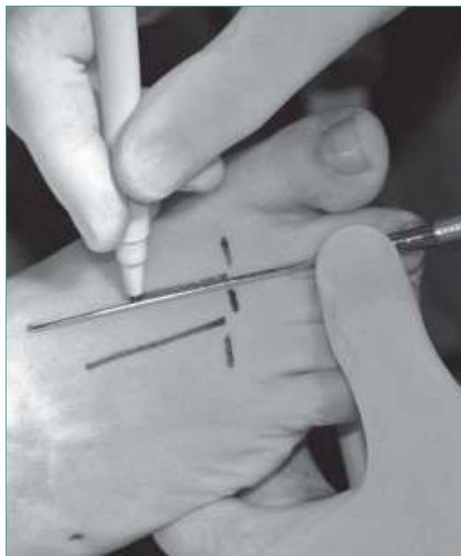
Figura 2. Identificación con el lápiz quirúrgico de las referencias anatómicas.

4. Introducción del disector específico de partes blandas que deslizamos debajo del ligamento.