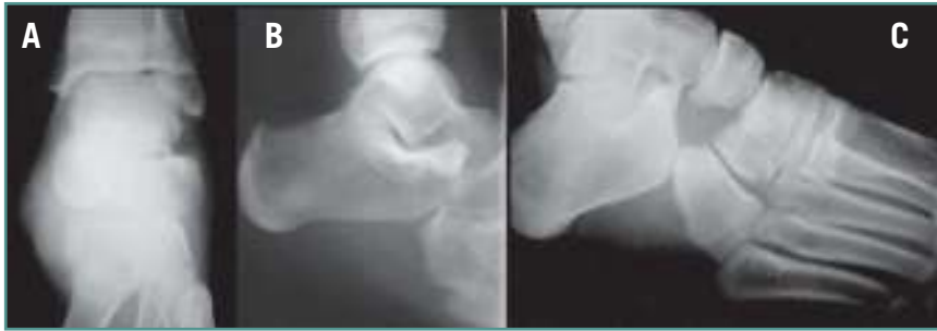
Figura 1. A: Proyección anteroposterior de tobillo. B: Proyección lateral de tobillo, donde se aprecia la incongruencia articular entre el calcáneo y el cuboides. C: Proyección oblicua del pie. Luxación calcáneo-cuboidea y escafocuneana.

Figure 1. (A) Antero-posterior X-ray of the ankle. (B) Lateral X-ray of the ankle illustrating the articular incongruence between Os calcaneus and Os cuboideus . (C) Oblique X-ray of the midfoot: calcaneo-cuboidal and scapho-cuneate luxations.