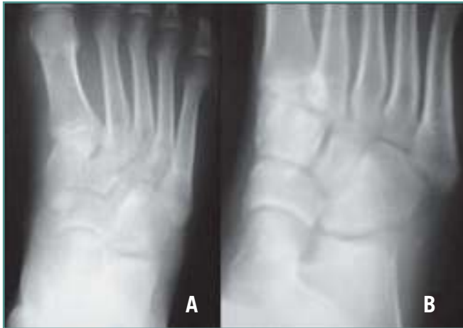
Figura 4. Proyección anteroposterior (A) y oblicua (B) de pie al final del seguimiento. Se mantiene la congruencia articular entre calcáneo y cuboides.

Figure 4. (A) Antero-posterior and (B) oblique X-rays of the foot at the end of the follow-up. The calcaneo-cuboid articular congruence persists.