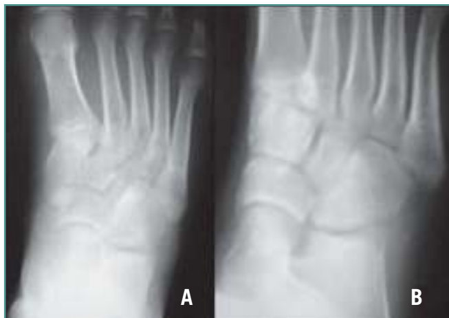
Figura 4. Proyección anteroposterior (A) y oblicua (B) de pie al final del seguimiento. Se mantiene la congruencia articular entre calcáneo y cuboides.

Figure 4. (A) Antero-posterior and (B) oblique X-rays of the foot at the end of the follow-up. The calcaneo-cuboid articular congruence persists.