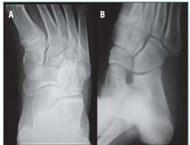
Figura 3. Radiografía anteroposterior (A) y oblicua (B) de pie tras la retirada de yeso a las 6 semanas. Se observa la congruencia articular entre calcáneo y cuboides.

El diagnóstico de certeza se obtiene con el estudio radiológico antero-posterior, lateral y oblicuo del pie afecto. En caso de duda, se deben realizar radiografías comparativas del pie contralateral (12) . A veces es necesario realizar la TAC con cortes longitudinales y coronales para valorar la extensión y la inestabilidad de la lesión, pudiéndonos dar el diagnóstico al pasar inadvertida la fractura en el estudio radiográfico (1) .