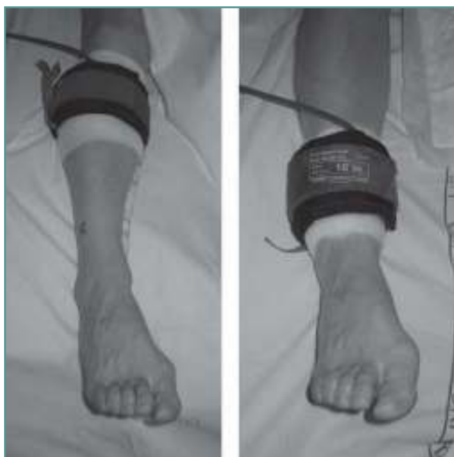
Figura 2. Colocación del manguito de isquemia en pantorrilla y tobillo.

Figure 2. Placement of the ischaemia cuff at the calf and at the ankle.