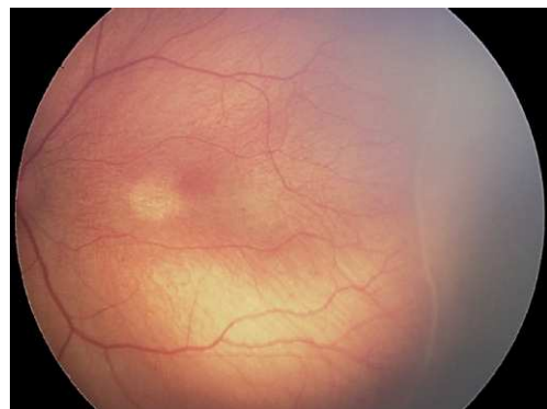
Figura 1. ROP grado 1: línea de demarcación entre retina vascular y avascular.

En cuanto a la extensión de la enfermedad, se determina en sectores horarios (cada sector horario equivale a 30° de circunferencia).