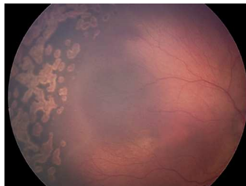
Figura 3. Cicatrices de láser.

Aunque el método de referencia o gold standard en el diagnóstico de la ROP sigue siendo la oftalmoscopia binocular, parece necesario desarrollar métodos alternativos, nuevas tecnologías para que el cribado sea fácil, seguro y coste-efectivo. A partir de la telemedicina, se puede tener la oportunidad de mejorar estos aspectos. El fin sería identificar aquellos niños con ROP suficientemente severa para justificar la opinión experta de un oftalmólogo. Actualmente, el sistema RetCam de retinografía digital permite tomar imágenes de la retina del prematuro por personal entrenado que no tiene por qué ser un oftalmólogo, y estas imágenes almacenadas en soporte informático ser enviadas a distancia a través de la red para su valoración por un oftalmólogo experto. La telemedicina promete