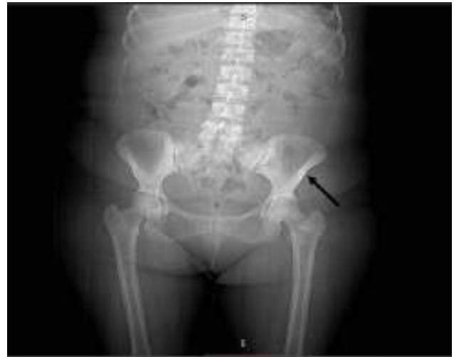
Figura 1 Radiografía de pelvis: Se aprecia osteoesclerosis en ambas ramas pubianas con predominio en lado izquierdo (flecha negra).

Mujer de 47 años con antecedente de anemia de 4 años de evolución (9 g/dL), que acude al servicio de Medicina Interna por presentar fatiga, síncope y disnea a medianos esfuerzos, además de dolor urente en región costal irradiado a columna dorsolumbar y miembros inferiores, que persiste por más de 6 meses. La paciente refiere no tener otros antecedentes patológicos de importancia. Al examen físico presenta dolor a la palpación en columna dorsolumbar y miembros inferiores que afecta la deambulación. Resto de examen físico dentro de parámetros normales. La analítica muestra un valor de hemoglobina de 8.4 g/dL, un recuento de leucocitos de 1,620 células, neutropenia (910 células), linfopenia (530 células) y anisocitosis. Exámenes sanguíneos adicionales revelan altos niveles de inmunoglobulina A (2,087). El proteinograma electroforético en suero reveló presencia de pico monoclonal; en la inmunofijación este demostró ser inmunoglobulina A tipo kappa. Los estudios de imágenes realizados revelaron lesiones escleróticas en cadera además de osteólisis (fig. 1). El estudio histopatológico de la biopsia de médula ósea muestra presencia de osteoesclerosis y pocas células plasmáticas (fig. 2); se observa dispersos elementos eritroides, escasos elementos mieloides y algunos megacariocitos dismórficos, con lo que se concluye médula ósea