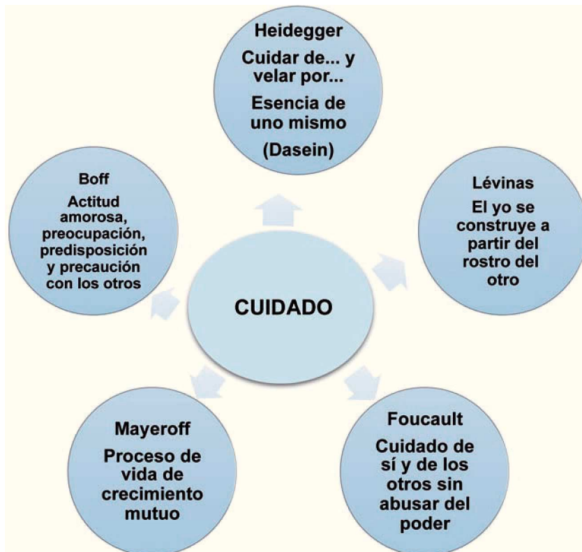
Figura 2 Noción del cuidado desde los filósofos contemporáneos.