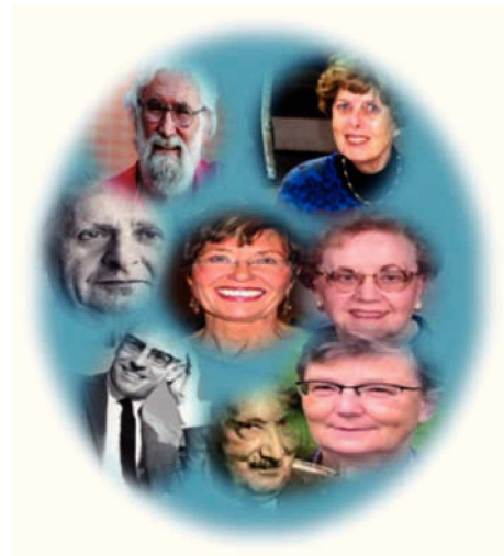
Figura 1 Filósofos del cuidado.

Al considerar que el cuidado es la expresión del trabajo amoroso, científico y técnico, que la enfermera realiza junto con la persona, con el propósito de desarrollar sus potencialidades, para construir formas de bienestar, mantener la vida, recuperar la salud o preparación para la muerte, que ocurre en los diferentes escenarios en donde se desarrolla o en donde procura su salud 3 ; concibe a la persona como la unidad esencial del cuerpo que le permite mediar entre la naturaleza, la cultura y el espíritu, como ser único indivisible y particular (espiritual, emocional, física, cultural, religiosa y social), que piensa, siente, quiere, desea, tiene alegrías, tristezas, objetivos y planes que le posibilitan su autorrealización, la libertad y la acción; consecuentemente se sugiere que la tarea del cuidar está infundida por la filosofía, ya que implica el análisis de los propósito de la vida humana, de la naturaleza del ser y de la realidad, de los