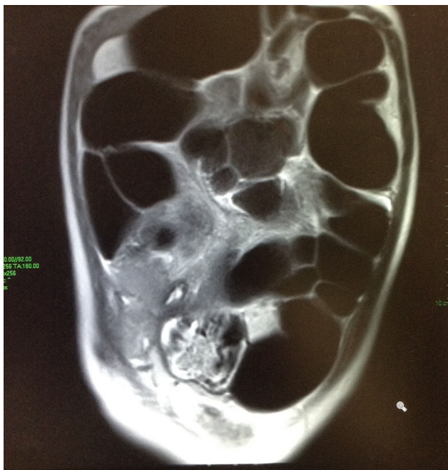
Figura 2 Resonancia magnética simple de abdomen: Dilatación en intestino delgado y grueso con abundante líquido y gas en su interior. Se observa gas hasta la zona del recto. Sin evidencia de colecciones líquidas extraluminales, ni datos de obstrucción mecánica.

los síntomas, así como progresión de la vía oral. El paciente fue dado de alta con buen estado clínico.