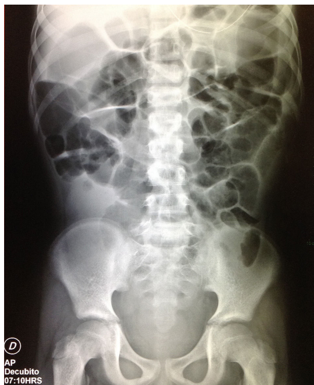
Figura 3 Radiografía de abdomen AP en decúbito dorsal: se observa disminución de la dilatación del colon y el gas en intestino delgado, pero aún persiste líquido en topografía del colon ascendente y recto. Se observa sonda a nivel de epigastrio.

isquemia o perforación intestinal, embarazo, arritmias cardíacas, broncoespasmo severo o insuficiencia renal 1 . De ahí la importancia de descartar con la resonancia magnética datos de obstrucción, y de verificar que el riñón trasplantado trabaje adecuadamente. En pacientes pediátricos se ha descrito el uso de 0.1 mg de neostigmina con incremento de dosis hasta 0.05 mg cada 20 min, hasta la recuperación de la motilidad gastrointestinal y la reducción de la distensión abdominal o hasta la dosis máxima de 0.05 mg/kg 2 . En este paciente se utilizó casi la dosis máxima, 0.04 mg/kg, requiriendo tres dosis, lo cual resultó en una franca mejoría clínica y radiológica. (fig. 3) que fue progresiva, por lo que finalmente se decidió su alta hospitalaria.