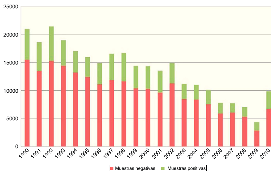
Figura 1 Frecuencia de positividad a parasitosis y comensales por año.

La tendencia en el comportamiento de las parasitosis intestinales a lo largo de las dos décadas estudiadas mostró cambios, tanto en la frecuencia como en los géneros y especies de los agentes, que se reportaron en este nivel de atención a la salud pediátrica. Estos cambios se pueden observar claramente en los gráficos de distribución de