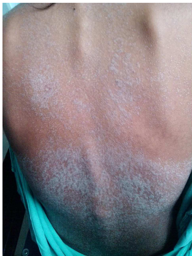
Figura 2 Dermatitis generalizada constituida por placas escamosas de predominio en tronco y extremidades.

Las manifestaciones clínicas del síndrome DRESS suelen aparecer a las 2-8 semanas de la exposición al fármaco, o dentro de las primeras horas, si existe sensibilización previa 10,19 . A menudo la fiebre es el primer síntoma. Las lesiones cutáneas (presentes en el 85% de los casos) aparecen 24-48 h después. Consisten en erupciones maculares eritematosas de tipo morbiliforme localizadas en la cara, tronco y extremidades que evolucionan a erupciones eritematosas papulares, confluentes, simétricas y pruriginosas, con infiltración edematosa y especialmente perifolicular. Se destaca el edema facial, principalmente en la frente, región periorbitaria, manos y pies, así como la presencia de conjuntivitis. Esta erupción puede asociarse con vesículas, ampollas, pústulas, lesiones en diana atípicas, púrpura y descamación 20 . La afectación de las mucosas es poco frecuente, aunque se puede manifestar como conjuntivitis,