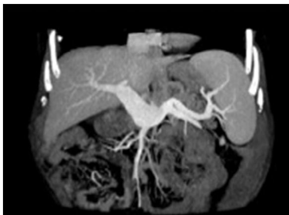
Figura 1 AngioTC demonstrando a presença de aneurisma da veia porta extra-hepática.