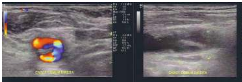
Figura 1 Eco-Doppler: dissecção da artéria carótida comum em incidência transversal e longitudinal.

Na consulta de 1.º mês de pós-operatório, o eco-Doppler carotídeo mostrou uma imagem compatível com uma dissecção na carótida comum em zona de clampagem (fig. 1). Assintomática.