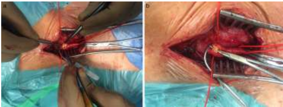
Figura 2 Imagem intraoperatória da dissecção da artéria carótida comum.