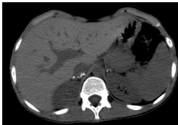
Figura 3. TC das suprarrenais - calcificações em ambas as glândulas suprarrenais.

A radiografia torácica foi pouco esclarecedora, pelo que se avançou para uma TC torácica que mostrou alterações sugestivas de sequelas de doença granulomatosa: «...gânglios de dimensões normais porém calcificados na cadeia paratraqueal direita, na região peri-hilar esquerda e na região pré-aórtica, todos com dimensões infracentimétricas, provavelmente residuais; granuloma calcificado e milimétrico no lobo inferior do pulmão esquerdo...» (fig. 4).