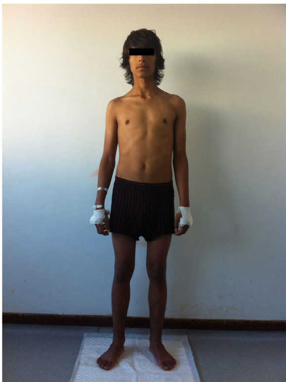
Figura 1. Aspeto emagrecido, hiperpigmentação da pele.

efeitos androgénicos, a DHEA poderá atuar como neurosteróide com possíveis efeitos no humor, capacidade de aprendizagem e bem-estar. Com base na evidência disponível, a substituição não deve ser feita por rotina em doentes com ISR 8 .