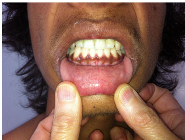
Figura 2. Hiperpigmentação da mucosa gengival.

O estudo analítico evidenciava hiponatremia (113 mmol/L), hipercaliemia (6,2 mmol/L), creatinina 0,73 mg/dL, ureia 78 mg/dL, glicemia 71 mg/dL, ALT/AST 73/50 UI/L. O exame sumário de urina era normal (densidade 1,018, pH 6,5). O sódio urinário