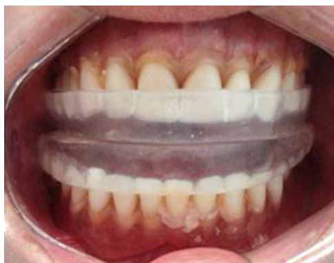
Figura 3 – Aparelho duplo assentado diretamente sobre próteses.

Os voluntários foram orientados a permanecerem em pé, relaxados e com a cabeça em posição natural, não forçada.