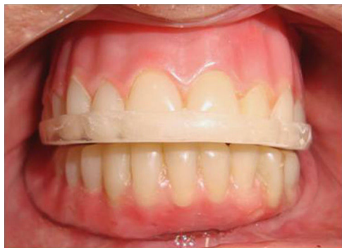
Figura 2 – Aparelho monomaxilar assentado diretamente sobre a prótese superior.

evitar báscula durante os movimentos mandibulares. Nos aparelhos monomaxilares, o número mínimo de pontos de contato com os dentes antagonistas foram 3, 2 bilaterais posteriores e um na região anterior. Nos duplos, buscou-se a maior área de contato entre as superfícies oclusais dos aparelhos.