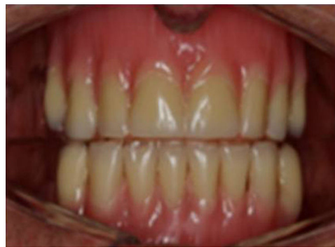
Figura 1 – Aparelho duplo com dentes, somente para efeito estético, assentado diretamente sobre o rebordo alveolar.

Para os voluntários com próteses sem retenção, foram feitas moldagens do rebordo residual pela técnica convencional