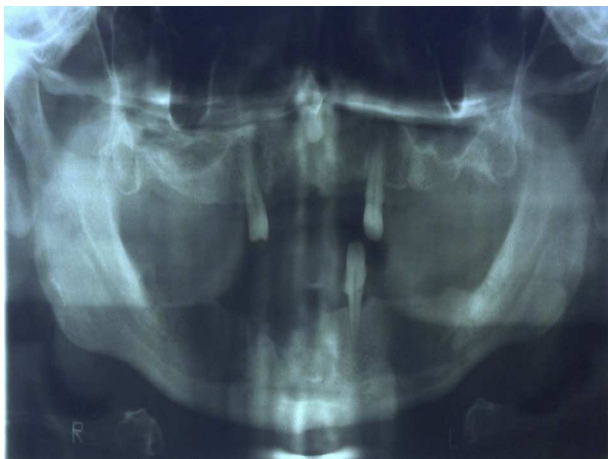
Figura 2 – A radiografia panorâmica mostrou área sugestiva de necrose óssea com radiopacidade irregular na região de pré-molares e molares direita da mandíbula.