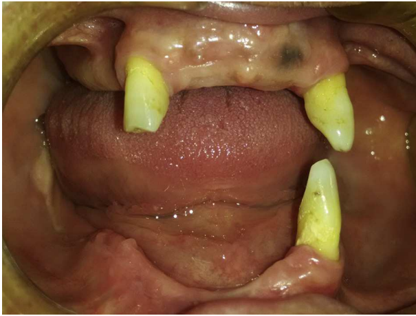
Figura 7 – Pós-operatório (12 meses) a região antes necrótica apresenta-se completamente cicatrizada.

O acompanhamento clínico e radiográfico de 12 meses revelou cura do quadro (figs. 7 e 8).