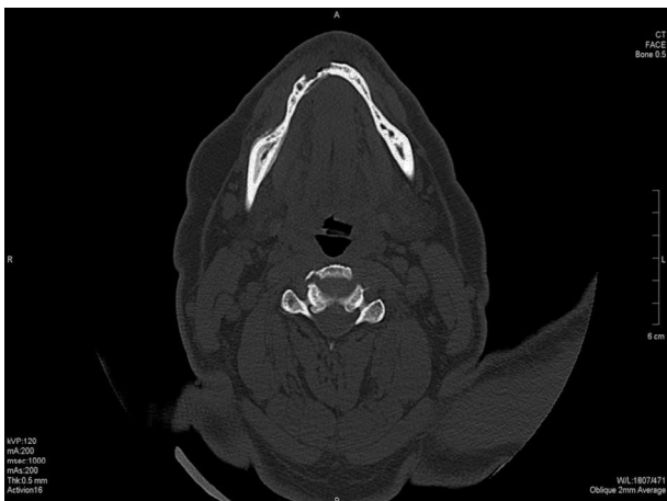
Figura 4 – Tomografia computadorizada (corte axial) evidenciando o processo inflamatório/infeccioso.

submetido à biópsia. O exame histopatológico mostrou que não havia tecido neoplásico, mas sim um processo inflamatório agudo e crônico e colônias bacterianas no tecido ósseo compacto necrosado (lacunas sem núcleos de osteócitos), que com análise específica para micro-organismos se identificou como colônias de Actinomyces (fig. 5). Diante do diagnóstico de osteonecrose da mandíbula, o tratamento com bisfosfonatos foi interrompido e medidas tópicas de higiene oral com clorexidina gel a 0,12% foram adotadas.