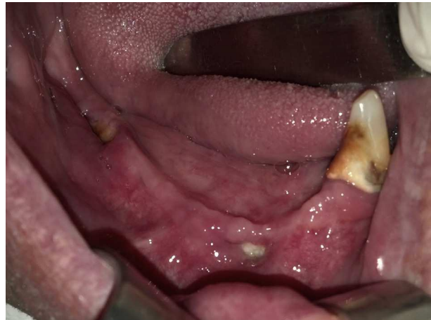
Figura 1 – Aspecto da cavidade bucal com a osteonecrose.

Paciente de 55 anos, masculino, portador de diabetes e hipertensão arterial controlados, fumador, com diagnóstico de MM