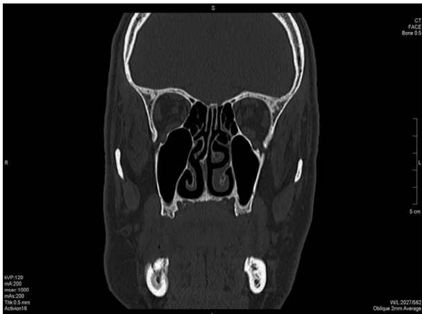
Figura 3 – Tomografia computadorizada (corte coronal) evidenciando os limites da lesão.