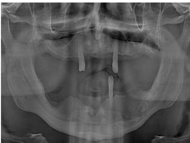
Figura 8 – Radiografia panorâmica de controle revelando a neoformação óssea nas áreas afetadas.

Num estudo anterior 12 foram acompanhados 97 casos por um ano ou mais e foi sugerido que o tratamento deveria ser