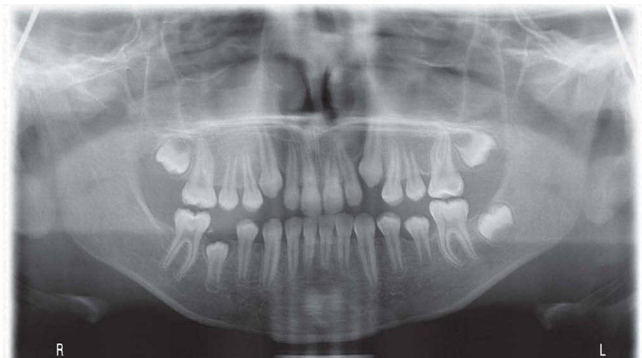
Figura 1 - Radiografia panorâmica de um paciente com agenesia do dente 47.

Foi identificado um caso de dentes supranumerários envolvendo a dentição decídua e outro caso envolvendo a dentição permanente. O primeiro caso corresponde a um incisivo lateral maxilar extra (fig. 2). No segundo caso o paciente possuía um incisivo lateral mandibular extra. Neste último caso, o paciente apresentava igualmente, uma gemação na dentição decídua. Ambos os casos foram identificados