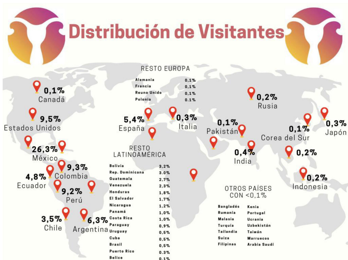
Figura 2 Distribución geográfica de los visitantes del canal de YouTube @aulaginecologia.

y resumido. Presenta gran satisfacción por parte de los usuarios, contribuyendo a facilitar y mejorar la formación en obstetricia y ginecología.