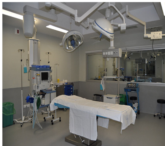
Figura 2 Escenario de simulación quirúrgico.

de todas las funciones cardíacas, vasculares y pulmonares. Según la intervención del alumno emite una respuesta que el instructor programa y dirige. De esta forma el simulador puede mantener un diálogo con el alumno respondiendo a las preguntas de la historia clínica, el alumno explora y encuentra pulsos, ruidos respiratorios, cardíacos, abdominales, secreciones, expectoración, edema de lengua y de glotis, vómitos, líquidos en los circuitos vasculares, vejiga, estómago, pleura, pulsos, parpadea, hay reacción pupilar y lagrimeo. Permite la monitorización continua de gran número de parámetros y la realización de muchas técnicas e intervenciones médicas y quirúrgicas 4 (cateterización de vías centrales y periféricas, intubación, sondajes, punciones de cavidades, ventilación mecánica...).