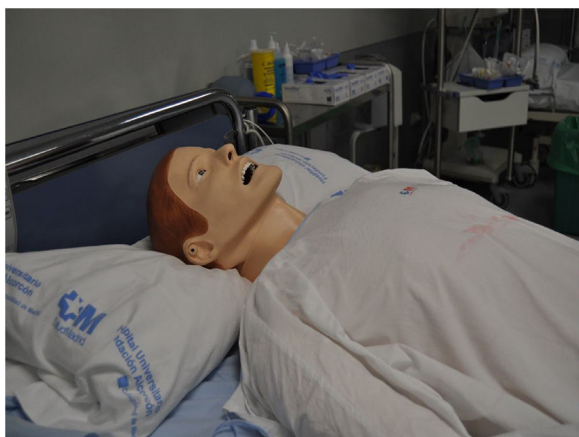
Figura 1 Maniquí de simulación clínica de alta tecnología.