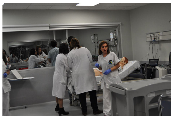
Figura 3 Actividad de simulación.

El simulador, sea de la complejidad que sea, es un mero instrumento. El mérito de un simulador no es su complejidad sino su utilidad y la frecuencia y aceptación para su uso. Para poder llevar a cabo los escenarios de simulación es preciso formar a los instructores-tutores tanto en el manejo del maniquí como en el diseño e implementación de las actividades. El esfuerzo requerido por los tutores para adquirir las habilidades necesarias es mucho mayor que para otras metodologías. El tiempo necesario para planificar y ejecutar cada actividad es elevado. En resumen, es necesario dotar de importantes recursos materiales, humanos y económicos para poder desarrollar y mantener en el tiempo cualquier actividad de simulación.