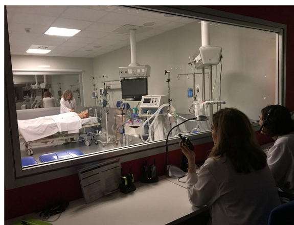
Figura 4 Sala de control e instructores de simulación.