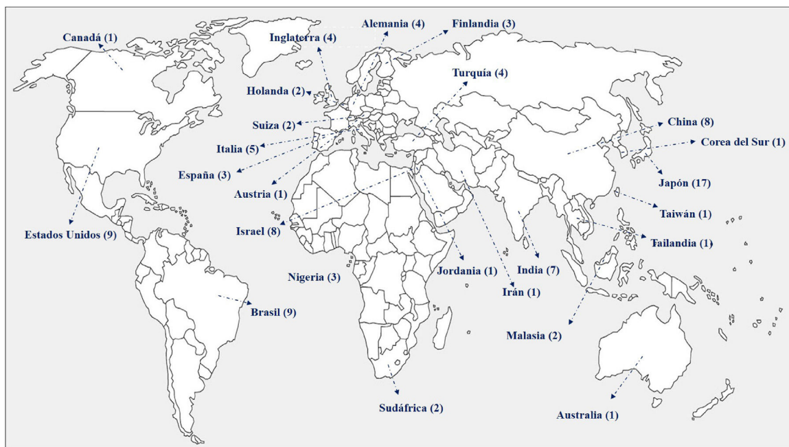
Figura 1 Distribución de los artículos según la filiación de los autores.

La figura 1 muestra la filiación de los autores, observándose un predominio de documentos de autoría japonesa (n=17). Le continúan: Brasil y Estados Unidos (n=9), así