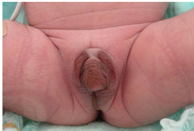
Figura 1 Genitales ambiguos al nacimiento.

Ante el hallazgo de un recién nacido con genitales ambiguos y una estructura compatible con útero en ecografía de urgencia, el diagnóstico más probable es una virilización de una mujer 46 XX, siendo la causa más frecuente la hiperplasia suprarrenal congénita por el déficit de 21-hidroxilasa. Al demostrarse un sexo genético 46 XY, el trastorno de la diferenciación sexual 46 XY es más complejo de filiar 2 . El estudio del gen SRY, principal gen implicado