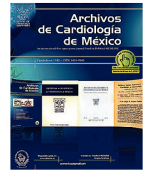
IMAGEN EN CARDIOLOGÍA