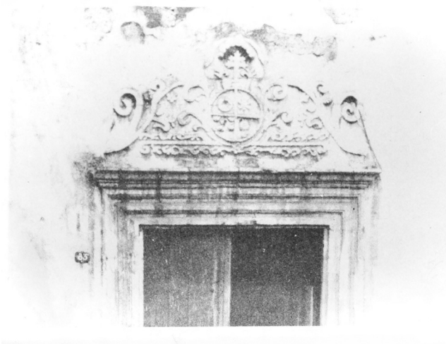
Figura 1 La doble cruz, símbolo de la afiliación al archihospital romano de Santo Spirito, en la fachada de la iglesia del Hospital de San Juan de Dios, en Pátzcuaro, Mich.

Los hospitales americanos surgieron con características semejantes a las de los nosocomios europeos de la Edad Media y al mismo tiempo con rasgos de las ideas más avanzadas de su tiempo 1 . El primer hospital americano se inauguró el 29 de diciembre de 1503 en la Isla de Santo Domingo: Hospital de San Nicolás de Bari, fundado por el entonces gobernador Nicolás de Ovando, perteneciente a la Orden Militar de Alcántara. Este hospital consiguió, en 1541, su filiación al archihospital romano de Santo Spirito, así como la obtuvieron otros hospitales mexicanos y peruanos. Aún pueden verse sobre las fachadas de las iglesias de dichos hospitales los emblemas de su filiación: la doble cruz y un símbolo del Espíritu Santo (fig. 1). A su vez, el primer hospital de la América continental fue el de la Inmaculada Concepción, creado en México por Hernán Cortés en el año 1524 2 . Tenía una configuración en «T» como el de Santiago de Compostela, diseñado por el arquitecto Enrique Egas a fines del siglo xv. Tal vez Cortés, quien se ocupó personalmente del proyecto del edificio, tuviera presente aún el archihospital romano de Santo Spirito, reconstruido entre 1473 y 1476 con una planta en forma de «tau».