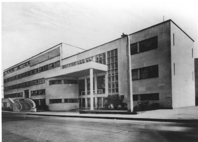
Figura 3 El primer Instituto Nacional de Cardiología de México 1944-1976.

un limitado sector de objetividad. Es, por ende, una ciencia particular. Cada una, en el desenvolvimiento de su plan por el método correspondiente, debe especializarse en un dominio bien circunscrito. Por consiguiente, la especialización y la superespecialización no constituyen de ninguna manera un mal necesario, porque se desprenden de la exigencia esencial de la ciencia, que es una investigación. Es incorrecto decir que la investigación no es un movimiento organizado por el hecho de que su quehacer se realiza en diferentes instituciones. Estas son indispensables porque la ciencia, como investigación, tiene el carácter intrínseco de un movimiento de aprovechamiento organizado. Tal carácter permite a las ciencias lograr su cohesión y su unidad propia. En efecto, la ciencia se basa y al mismo tiempo se especializa en planes de sectores determinados de objetividad, planes que se desenvuelven en el procedimiento correspondiente, garantizados por el rigor. Dicho procedimiento se organiza en movimientos de explotación o, mejor dicho, de utilización metódica en centros de investigación. Es esta «el apetito de conocimiento y el fin de la investigación es el descubrimiento...» 7 . Por eso la especialización, nos recuerda Heidegger 8 : «es una consecuencia necesaria y positiva del ser de nuestra ciencia».