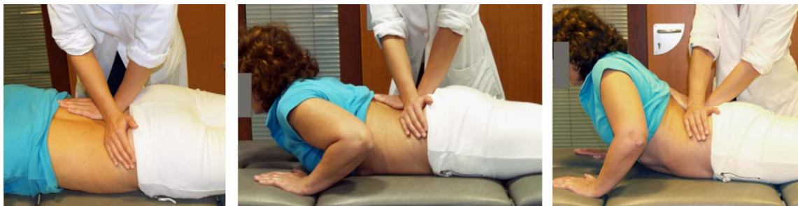
Figura 3 Automovilización en extensión con ayuda del fisioterapeuta.

tratamiento puede consistir igualmente en el mantenimiento de posturas en la preferencia direccional durante un cierto tiempo, por ejemplo, hacia la extensión como la que se muestra en la figura 1. El tratamiento puede consistir igualmente en el mantenimiento de posturas en la preferencia direccional durante un cierto tiempo. Como esta preferencia no es estable durante todo el tratamiento, habrá que ir adecuándola a la evolución del cuadro clínico. Por ejemplo, habrá pacientes que tienen una preferencia direccional hacia la extensión, que al principio la toleren bien de pie y no en prono o viceversa.