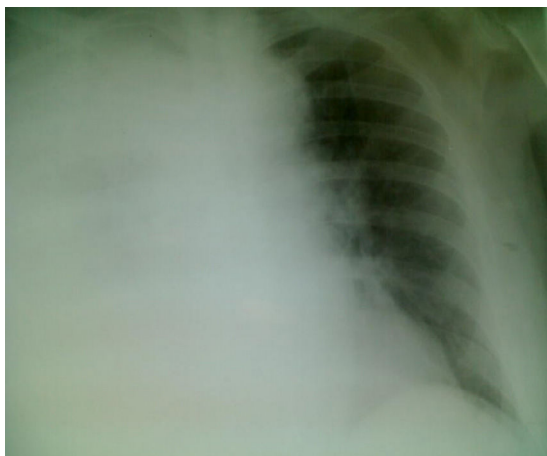
Figura 2 Proyección posteroanterior de radiografía de tórax con portátil, donde se aprecia afectación pulmonar con derrame pleural derecho total.

gramaticales en la escritura y desorientación espacial ocasional. La exploración física, incluyendo la neurológica, y la analítica son normales. Las pruebas de imagen craneales (tomografía axial computarizada y resonancia magnética nuclear) son normales. El electroencefalograma es normal. Se realiza punción lumbar y el líquido cefalorraquídeo resulta normal, incluyendo tinción de Gram, VDRL, reacción en cadena de la polimerasa para herpesvirus, citomegalovirus y virus de Epstein-Barr, y cultivos para Mycobacterium tuberculosis , listeria, neumococo, micoplasma y legionela. Dada la negatividad de todas las exploraciones y el antecedente reciente neumónico se diagnostica encefalopatía tras neumonía por L. pneumophila , prescribiéndose tratamiento psicológico estimulador. En la actualidad, el paciente sigue con afectación amnésica (que se ha estancado) y leve dificultad para la atención, habiendo mejorado la capacidad de cálculo, habla bien, escribe aceptablemente y han desaparecido los episodios de desorientación espacial.