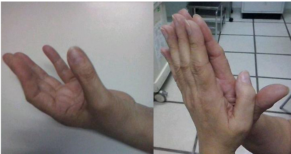
Figura 1 Exploración física de la paciente. En la parte izquierda de la imagen, se observa cómo la paciente es capaz de opositar y lateralizar el primer dedo («cuenta dedos») en la mano izquierda (la afectada). Sin embargo, en la parte derecha de la imagen, comparando con la mano sana (la derecha), se observa cómo la paciente es incapaz de realizar la extensión del primer dedo afectado (izquierdo) mientras mantiene en extensión el primer dedo sano (derecho).