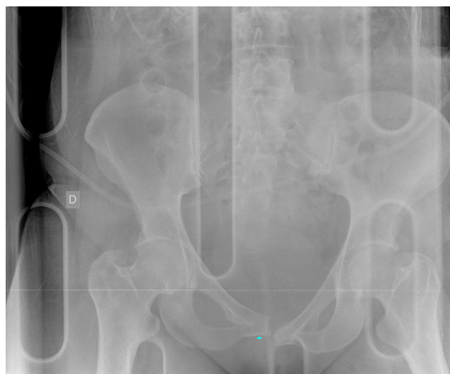
Figura 1 Radiografía de pelvis: fractura de rama isquiopúbica izquierda con luxación de sínfisis púbica.

Las lesiones del anillo pélvico están habitualmente asociadas a traumatismos de alta energía (sobre todo accidentes de tráfico) y conllevan un alto riesgo para la vida del paciente.