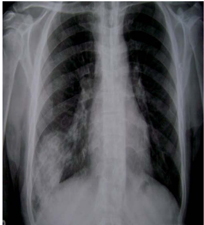
Figura 1 Caso 1. Radiografía anteroposterior de tórax: imagen de condensación inflamatoria en el lóbulo inferior del pulmón derecho compatible con neumonía basal derecha.