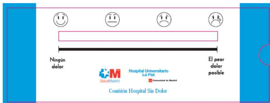
Figura 1 Escala de medición del dolor.