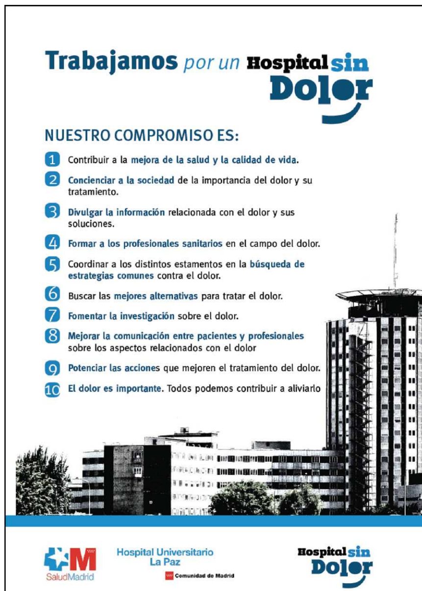
Figura A1 Cartel informativo de la Comisión.