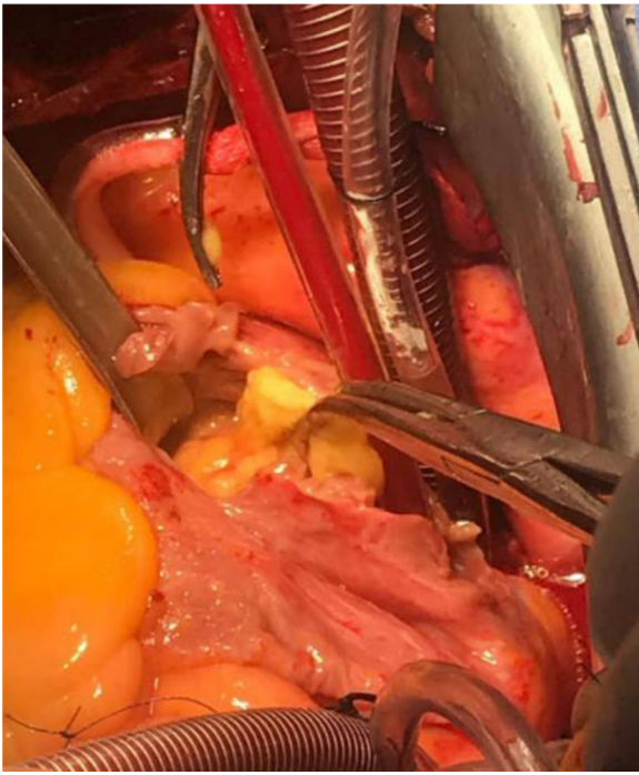
Figura 1. Canulación bicaval y auriculotomía con tumor adherido a la base de la aurícula derecha. Imagen en sentido caudo-cefálico.

conservada. Riesgo quirúrgico por STS ( Society of Thoracic Surgeons ): riesgo de mortalidad: 0,618%. Euroscore II 1,71%. Se decide ingreso a quirófano para resección de tumor intraauricular con canulación bicava y en derivación cardiopulmonar total, se realiza auriculotomía derecha encontrando lipoma intraauricular en base de aurícula derecha (fig. 1) con extensión a mediastino (fig. 2), el cual se reseca en su totalidad (fig. 3). Se realizó cierre directo de aurícula derecha con monofilamento de polipropileno 4-0. Tiempo de isquemia miocárdica 68 min y de derivación cardiopulmonar de 88 min en