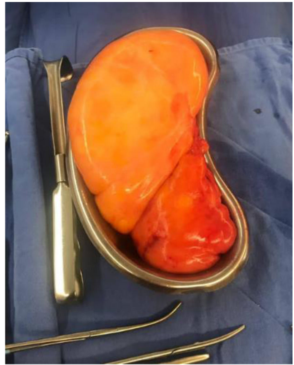
Figura 3. Lipoma extirpado, se observa bilobulado, bien delimitado, contenido homogéneo.

normotermia. Evolución posoperatoria favorable, extubación a las 48 horas, egreso hospitalario a los 8 días. Reporte de histopatología de dos piezas: lipoma intraauricular de 7 x 7 x 3 cm y mediastinal de 18 x 17 x 7 cm, bilobulado, encapsulado, peso de 1.300 g. Se contó con consentimiento informado tanto para los procedimientos realizados, como para la presentación del caso.