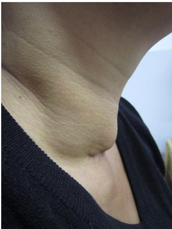
Figura 1. Nódulo en cara anterior de cuello, de perfil.

Los exámenes de laboratorio de rutina presentaron una velocidad de eritrosedimentación de 53 mm en la primera hora, las restantes determinaciones mostraron resultados dentro de los límites normales. Las serologías para VIH-1 y 2 fueron no reactivas y las pruebas de inmunodifusión y contraelectroforesis con histoplasmina y paracoccidioidina dieron resultados negativos.