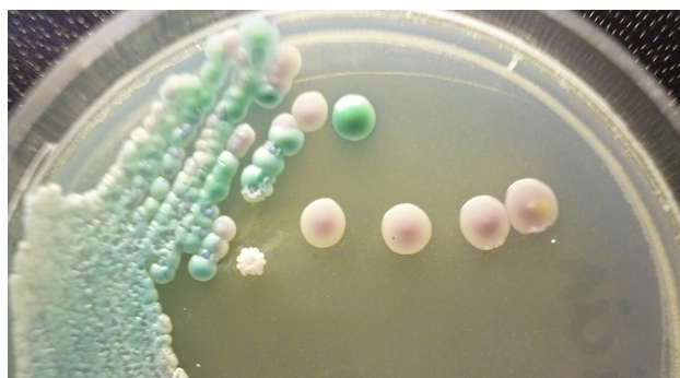
Figura 3. Aspecto macroscópico en medio cromogénico de las colonias de las dos levaduras aisladas.

Tras una semana de colocado el corsé, el paciente presentó una dermatitis aguda eritematopapulovesiculoescamosa, con zonas erosionadas en la región lumbar. Esta lesión cutánea era muy pruriginosa e incomodaba mucho al enfermo (fig. 2). Se pensó en un eccema de contacto o en una candidiasis de decúbito. Se tomaron escamas de piel para un examen micológico; en el examen microscópico directo con KOH al 40% se observaron elementos fúngicos y los cultivos presentaron el