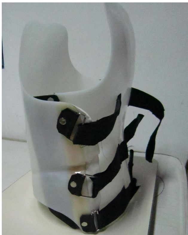
Figura 1. Corsé termoplástico que utilizaba el paciente.