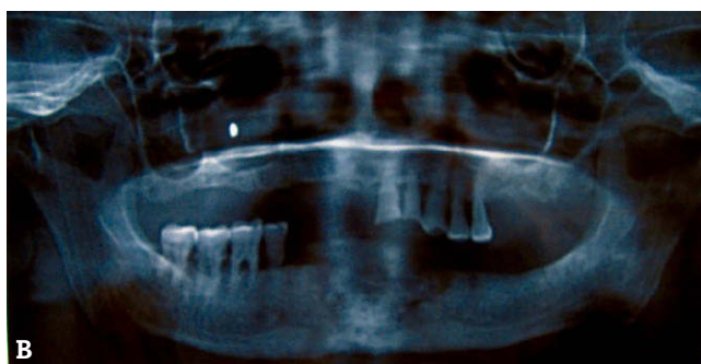
Figura 2 – A) Exposición ósea del paciente número 6 en el momento inicial. B) Radiografía panorámica al final del seguimiento, con persistencia de la osteonecrosis del maxilar relacionada con bifosfonatos (OMRB).

con BF orales después de consumir el alendronato (Fosamax®) en forma ininterrumpida durante más de 10 años.