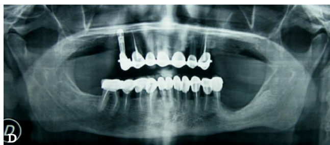
Figura 1 – A) Visión intraoral de la osteonecrosis del maxilar relacionada con bifosfonatos (OMRB) del paciente número 1. B) Radiografía panorámica inicial del mismo paciente. C) El paciente muestra curación de la mucosa al final del seguimiento. D) Radiografía panorámica del paciente número 1 al final del seguimiento.