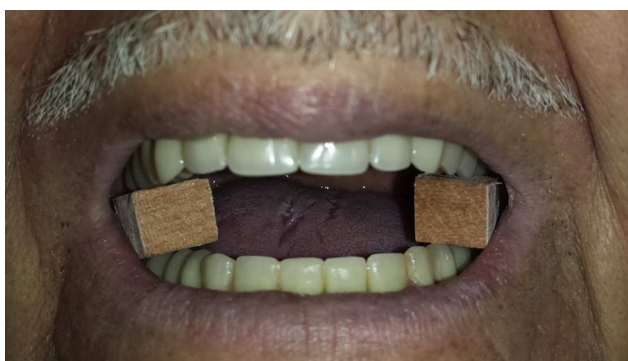
Figura 2 Fotografía de la colocación de los cubos de 10 mm a nivel premolar en un paciente del estudio.

horizontal paralelo al piso 14 . Para reproducir dicha posición se le pidió al paciente que se parara en una posición ortopédica y que mirara sus ojos en un espejo, después de realizar una serie de ejercicios de flexión de cuello 15 .