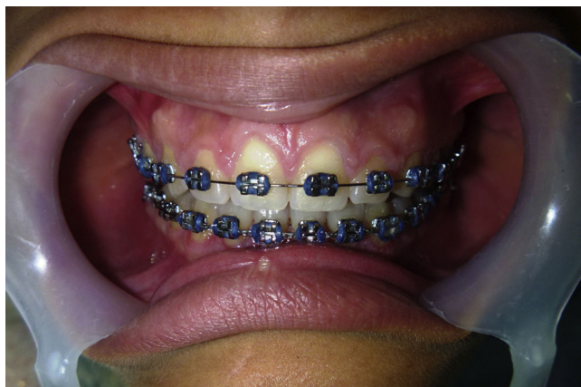
Figura 1 Agrandamiento gingival en individuo con aparatología ortodóncica fija.

un consentimiento informado donde aceptan participar en la investigación.