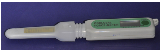
Figura 2 Dispositivo hidráulico digital GM10.

presencia de ambos apellidos de origen indígena. Por el contrario, la clasificación de los individuos no indígenas se realizó por la ausencia de ambos de sus apellidos de origen mapuche. Estos datos fueron recolectados durante una encuesta en la anamnesis.