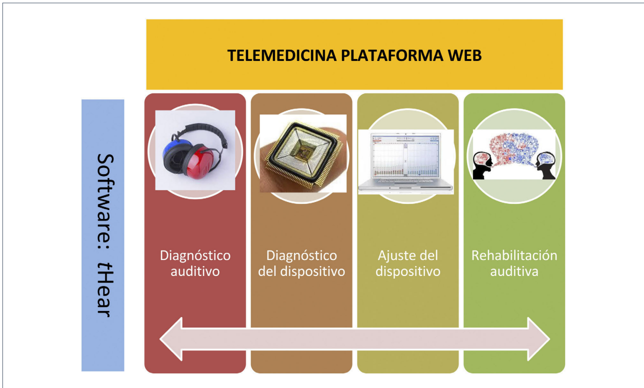
FIGURA 2. ESQUEMA SOBRE LA ESTRUCTURA DE UN SISTEMA DISEÑADO POR LA UNIVERSIDAD DE NAVARRA, APLICABLE EN EL CAMPO DE LA TELEMEDICINA Y AUDICIÓN

Consta de dos elementos principales: Plataforma web y Software "tHear", que contiene diferentes aplicaciones clínicas.