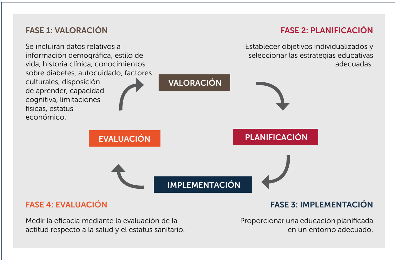
FIGURA 2. CÍRCULO DE LA EDUCACIÓN DIABÉTICA PERMANENTE