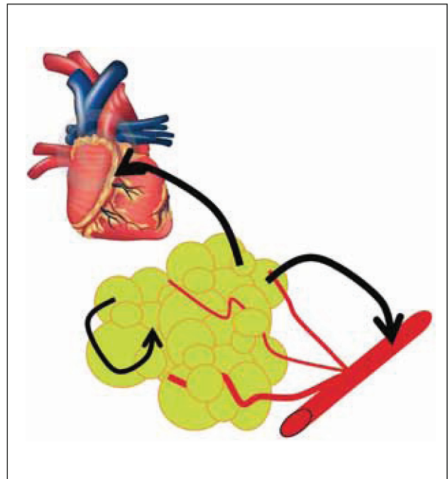
FIGURA 1. SITIOS DE ACCIÓN DE LAS ADIPOQUINAS SECRETADAS POR EL TEJIDO ADIPOSO

Los productos de secreción del tejido adiposo (adipoquinas) pueden ser llevados por el torrente circulatorio a órganos distantes (acción endocrina), actuar sobre órganos adyacentes (acción paracrina) o modificar su propio entorno (acción autocrina).