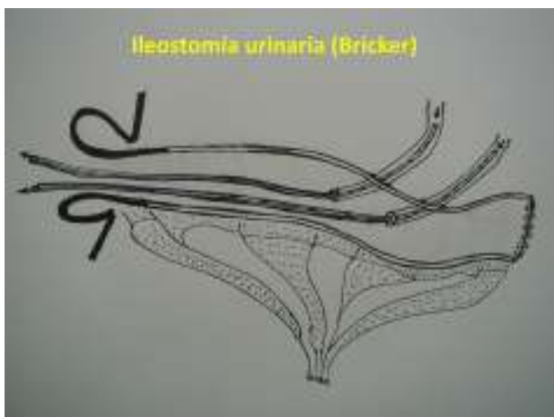
Figura 2 Implante ureteral sin anastomosis.

Seis pacientes recibieron neoadyuvancia con un esquema de radioquimioterapia preoperatoria de 45 Gy en 5 semanas (25 sesiones), más una sobreimpresión para alcanzar 50,4 Gy