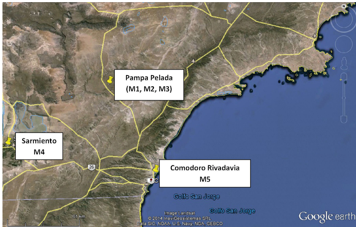
Figura 1 Áreas de estudio.

superficiales de Pampa Pelada, de la zona de chacras de Sarmiento y de suelos de la zona costera en Comodoro Rivadavia (Castro, comunicación personal).