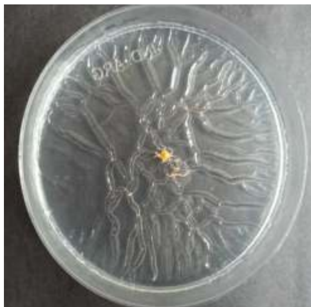
Figura 1 Observación macroscópica del crecimiento de M. chubuense en medio Middlebrook con 0,3% de agar, luego de 15 días de incubación a 30 °C. Tamaño natural.

Una colonia lisa de la bacteria se sembró en el centro de una placa de Petri que contenía agar Middlebrook (Difco) con glicerol (0,3% agar). Luego de 5 días de incubación a 30 °C se comenzaron a ver pseudofilamentos que partían del centro de la colonia. Las figuras 1 y 2 muestran el resultado luego de 15 días de incubación. A este tiempo se realizó microscopía