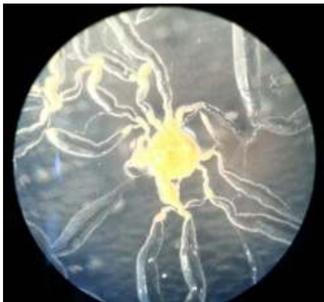
Figura 2 Observación en lupa de la movilidad por sliding (Olympus SZ61, aumento total: 6,7 ×).