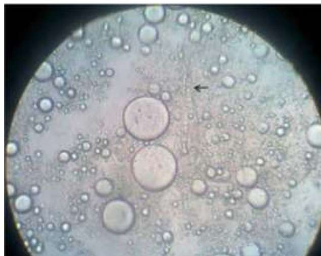
Figura 1 Filamentos anchos ramificados y cenocítico. En el preparado en fresco se señalan con flechas estas estructuras.

El estudio microscópico con azul de lactofenol realizado a partir del cultivo mostró la presencia de hifas gruesas no