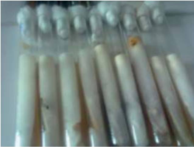
Figura 2 Micelio aéreo algodónoso de rápido desarrollo, blanco amarillento, en medio de Sabouraud.

septadas, esporangióforos ramificados, esporangios piriformes con apósis cónica alternados entre los rizoides y presencia de estolones. Estas características micromorfológicas permitieron identificar al hongo como Lichtheimia sp. (fig. 3).