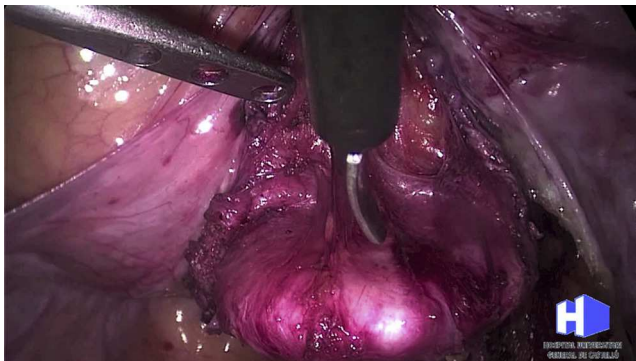
Figura 1 Disección del espacio vésico-vaginal.

En el siguiente paso, tras comprobar la ausencia de tensión de la malla, se une el brazo libre de la malla al sacro mediante autosutura con anclajes helicoidales de titanio