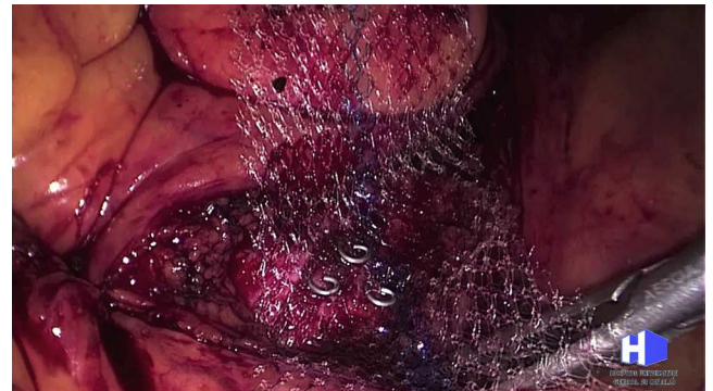
Figura 3 Colocación de anclajes helicoidales de titanio sobre el promontorio sacro.

El tiempo quirúrgico varió desde los 120 minutos hasta los 240 minutos, con un tiempo medio de 180. El tiempo