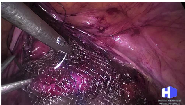
Figura 2 Fijación de la malla a cara anterior vaginal con puntos de Vycril.

(fig. 3). En este paso es importante la localización de la arteria sacra media para evitar su lesión con la colocación de las suturas mecánicas. La autosutura helicoidal de titanio de 5 mm, permite una fácil maniobrabilidad con un largo de 35,5 cm. Contiene 30 anclajes de titanio. El diámetro aproximado de los anclajes helicoidales es de 4 mm y un largo de 3,8 mm. Se peritoniza y cubre la malla con un monofilamento barbado (fig. 4) 20 . Se deja un drenaje pélvico de modo preventivo.