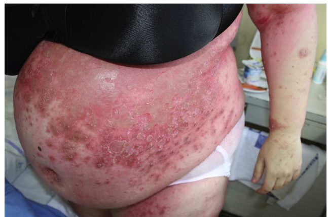
Figura 3 Extensión progresiva en dirección caudal con afectación de abdomen.

Con el paso de los días, y a pesar del tratamiento tópico intensivo (corticoides tópicos, eosina y emolientes), las