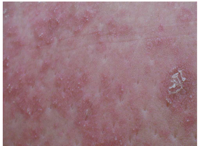
Figura 2 Múltiples pústulas de pequeño tamaño en los bordes de la placa y descamación superficial.

biopsia de las lesiones. Los cultivos fueron informados negativos y en el estudio histológico de la muestra se reveló una epidermis sin hiperplasia llamativa y ortoqueratosis en la mayor parte de la muestra alternando con pequeños focos de paraqueratosis en montículos. Se observaron una discreta espongirosis y la formación de abscesos neutrofílicos en capa superficial de la epidermis y en la capa córnea (microabscesos de Kogoj y Munro, respectivamente) (figs. 4 y 5). En la dermis, se observaron un discreto edema y un infiltrado inflamatorio linfohistiocitario perivascular superficial. Puntualmente, se observaron focos de exocitosis neutrofílica.