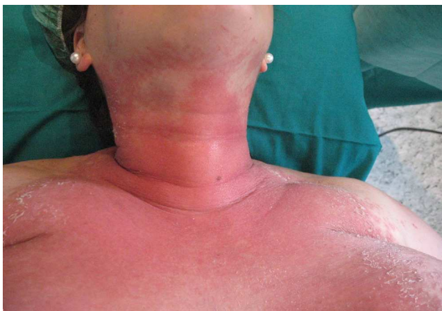
Figura 1 Gran placa eritematosa brillante-exudativa con áreas de tonalidad violácea.

Gestante de 28 semanas, que ingresó por cuadro de lesiones eritematosas generalizadas acompañado de fiebre y malestar general. Como antecedentes presentaba un hipotiroidismo primario autoinmune con tratamiento sustitutivo; aproximadamente 5 años antes presentó una crisis tirotóxica que requirió hospitalización. Durante el ingreso actual, se solicitó valoración a Dermatología por lesiones cutáneas de tipo eritematoso con pequeñas pústulas en forma de placas (figs. 1 y 2), que fueron progresando a pesar del tratamiento tópico corticoideo hasta formar una gran placa preesternal con abundantes pústulas en su periferia, junto con aparición de pequeñas placas eritematosas y pústulas en otras zonas del tórax y el abdomen superior (fig. 3). Se tomaron cultivos y